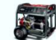
Gerador de 2 kva até 8 kva