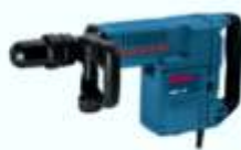
Marteleto de 5, 10 e 30 kg